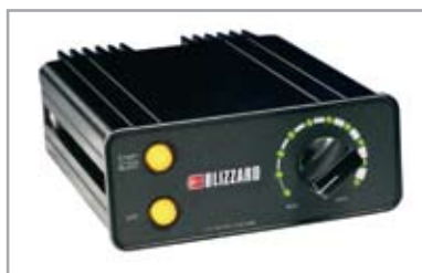
La commande de vitesse variable adapte le débit d'épandage aux conditions ambiantes.