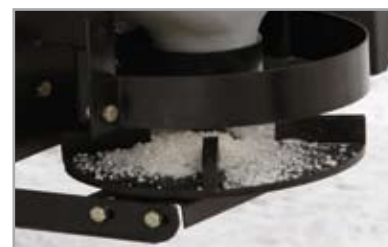
La sonde en polyvinyle de 25 cm permet une répartition uniforme du matériau dégivrant.