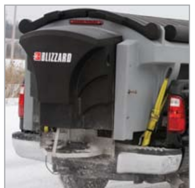
L'ENSEMBLE GLISSIÈRE EXCLUSIF hauteur plateaux L'ensem sonde en antirouille pour le r