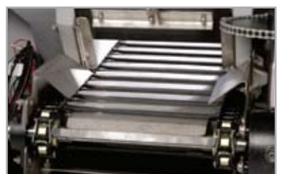
CONVOYEUR À CHAÎNE, À PIVOT, EN ACIER et logement en acier inoxydable anticorrosion alliant une conception éprouvée en termes de rendement optimal dans le secteur.