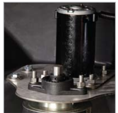
CONVOYEUR ÉLECTRIQUE DE SON manière qui vous taux d'ap en maté la vitesse un contr d'épanda