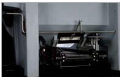
MESUREUR DE FLUX DES MATÉRIAUX AVEC RÂTELIER AJUSTABLE.