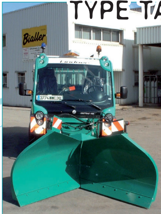
EN POSITION GODET