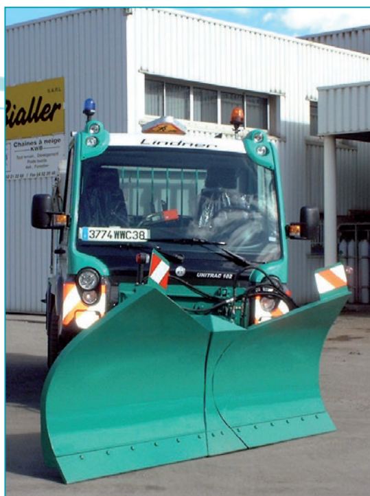
EN LAME BIAISE