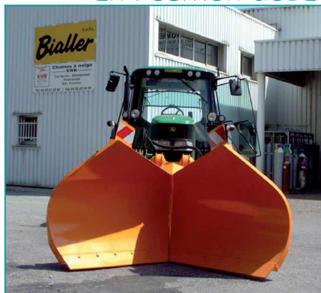
EN POSITION GODET

La plaque oscillante permet le débattement latéral de l'étrave. Cette plaque est très utile sur route en dévers ou route de montagne avec virage en épingle.