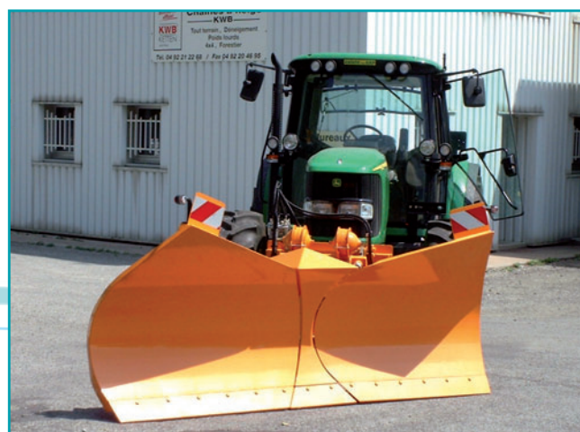
EN LAME BIAISE